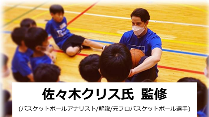
佐々木クリス氏 監修